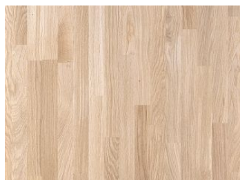
Płyty klejone z drewna litego Dąb Exclusive SW03