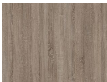
Płyta meblowa laminowana Dąb Truflowy 5194 SN